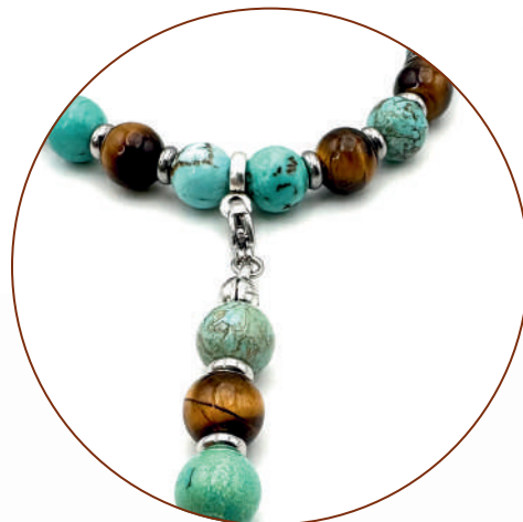
STILE 02 CON INSERTO NAPPINA