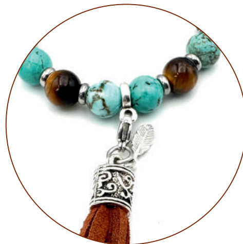
STILE 01 CON INSERTO IN PIETRE

Furthermore, each Mantra is made up of an exact number of stones which allows the necklace (thanks to the clasp) to be transformed into a multi-loop bracelet.